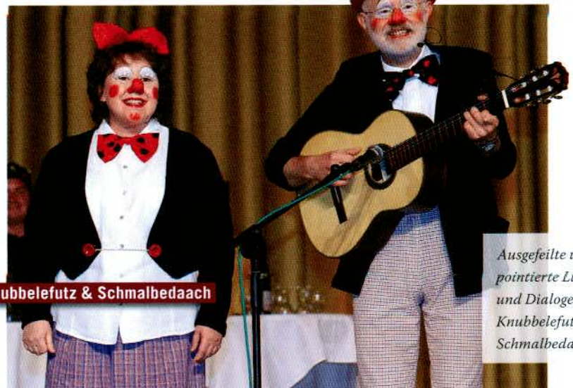
Knubbelefutz & Schmalbedaach